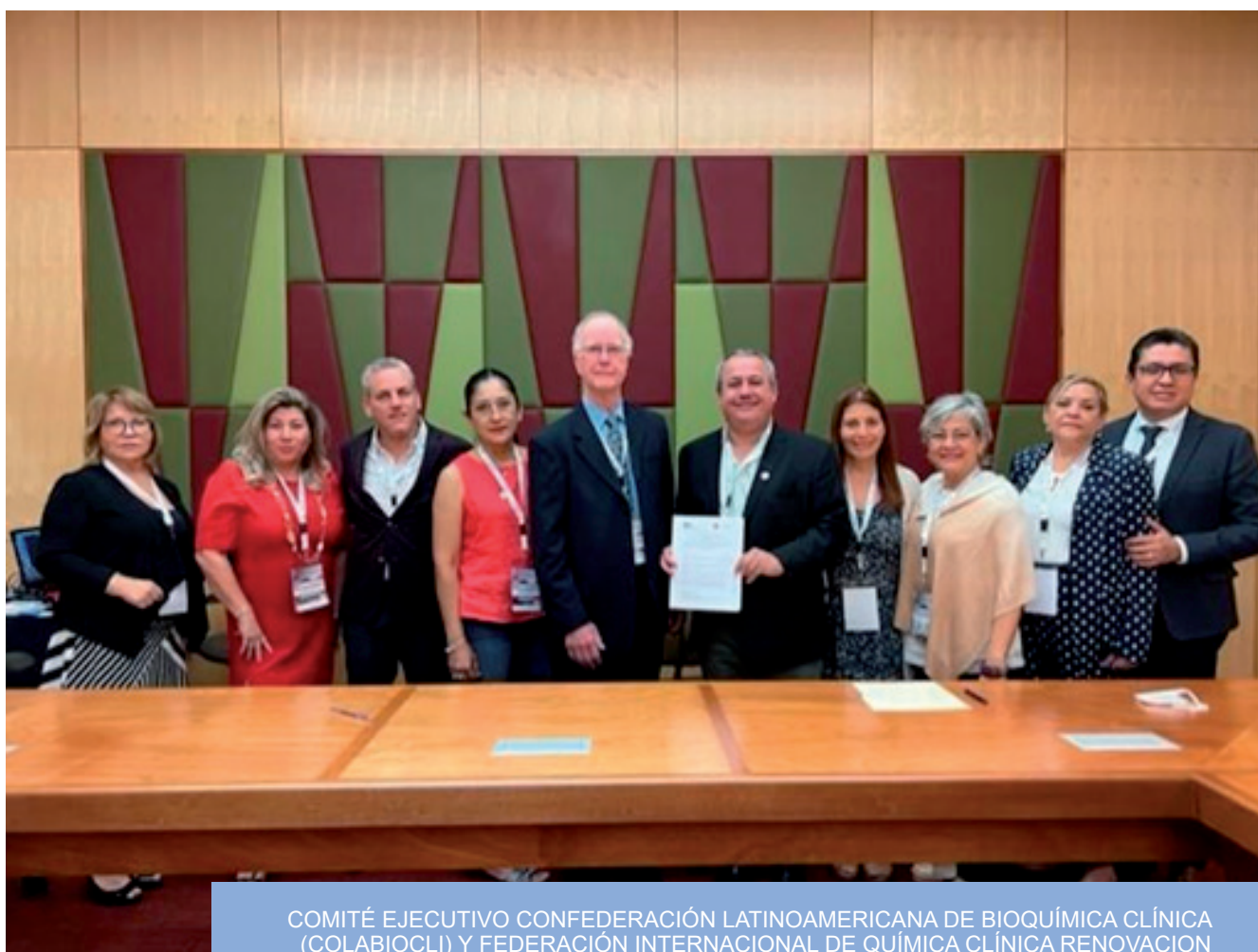
COMITÉ EJECUTIVO CONFEDERACIÓN LATINOAMERICANA DE BIOQUÍMICA CLÍNICA (COLABIOCLI) Y FEDERACIÓN INTERNACIONAL DE QUÍMICA CLÍNICA RENOVACION CONVENIO COOPERACION DURANTE EN EL XXV CONGRESO LATINOAMERICANO DE BIOQUÍMICA CLÍNICA LEÓN - GUANAJUATO MEXICO