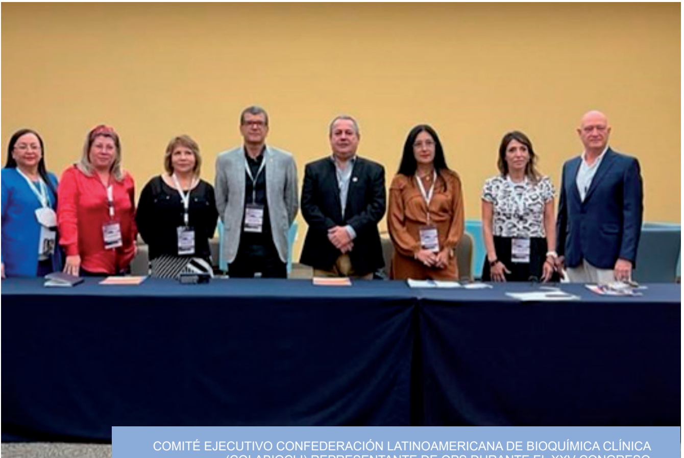
COMITÉ EJECUTIVO CONFEDERACIÓN LATINOAMERICANA DE BIOQUÍMICA CLÍNICA (COLABIOCLI) REPRESENTANTE DE OPS DURANTE EL XXV CONGRESO LATINOAMERICANO DE BIOQUÍMICA CLÍNICA. LEÓN - GUANAJUATO MEXICO