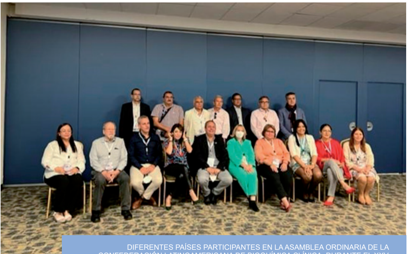
DIFERENTES PAÍSES PARTICIPANTES EN LA ASAMBLEA ORDINARIA DE LA CONFEDERACIÓN LATINOAMERICANA DE BIOQUÍMICA CLÍNICA, DURANTE EL XXV CONGRESO LATINOAMERICANO DE BIOQUÍMICA CLÍNICA LEÓN. - GUANAJUATO MEXICO